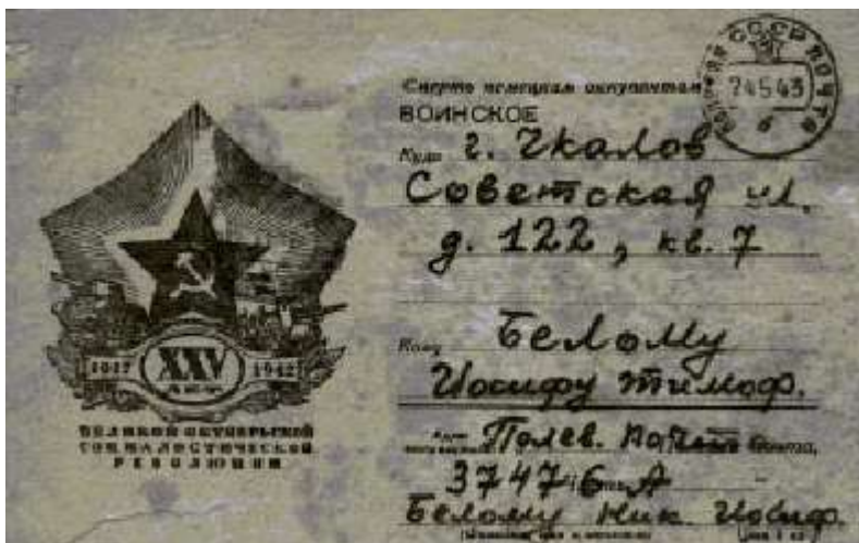
Письмо с фронта от 22 мая 1943 года