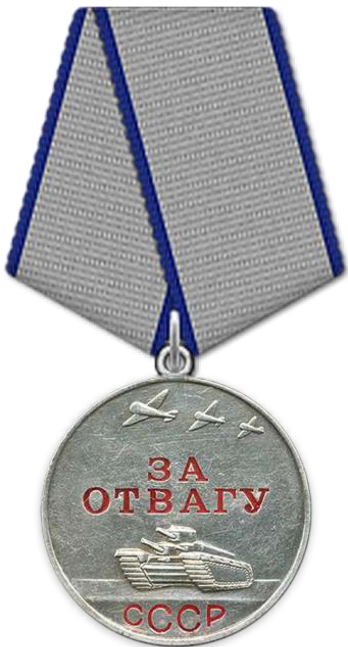
Медаль «За отвагу»