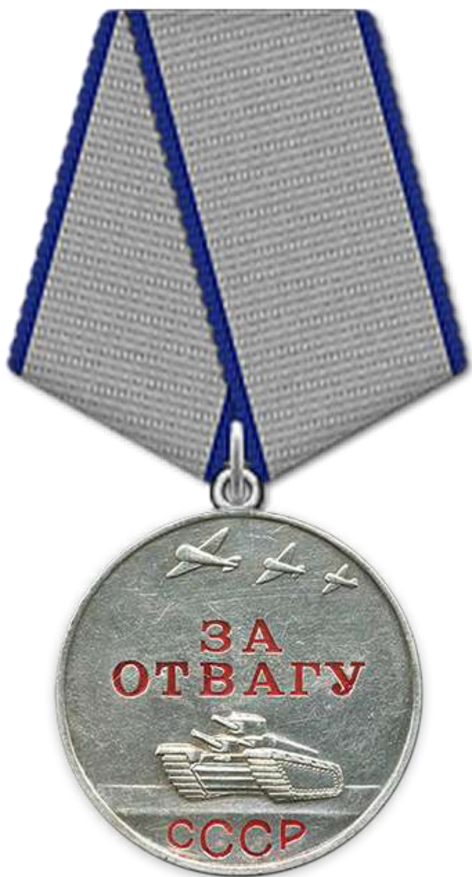
Медаль «За отвагу» 06.03.1945