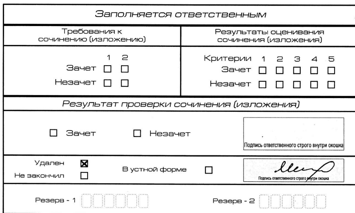
Рис. 13. Заполнение полей нижней части бланка регистрации (удаление с экзамена)

В случае если участник итогового сочинения (изложения) нарушил установленные требования, изложенные в пункте 28 Порядка проведения государственной итоговой аттестации по образовательным программам среднего общего образования (приказ Минпросвещения России и Рособрнадзора от 4 апреля 2023 г. № 232/551), он удаляется с итогового сочинения (изложения). Член комиссии по проведению итогового сочинения (изложения) составляет «Акт об удалении участника итогового сочинения (изложения)» (форма ИС-09), вносит соответствующую отметку в форму ИС-05 «Ведомость проведения итогового сочинения (изложения) в учебном кабинете ОО (месте проведения)» (участник итогового сочинения (изложения) должен поставить свою подпись в указанной форме). В бланке регистрации указанного участника итогового сочинения (изложения) необходимо внести отметку «X» в поле «Удален». Внесение отметки в поле «Удален» подтверждается подписью члена комиссии по проведению итогового сочинения (изложения) (см. рис. 13).